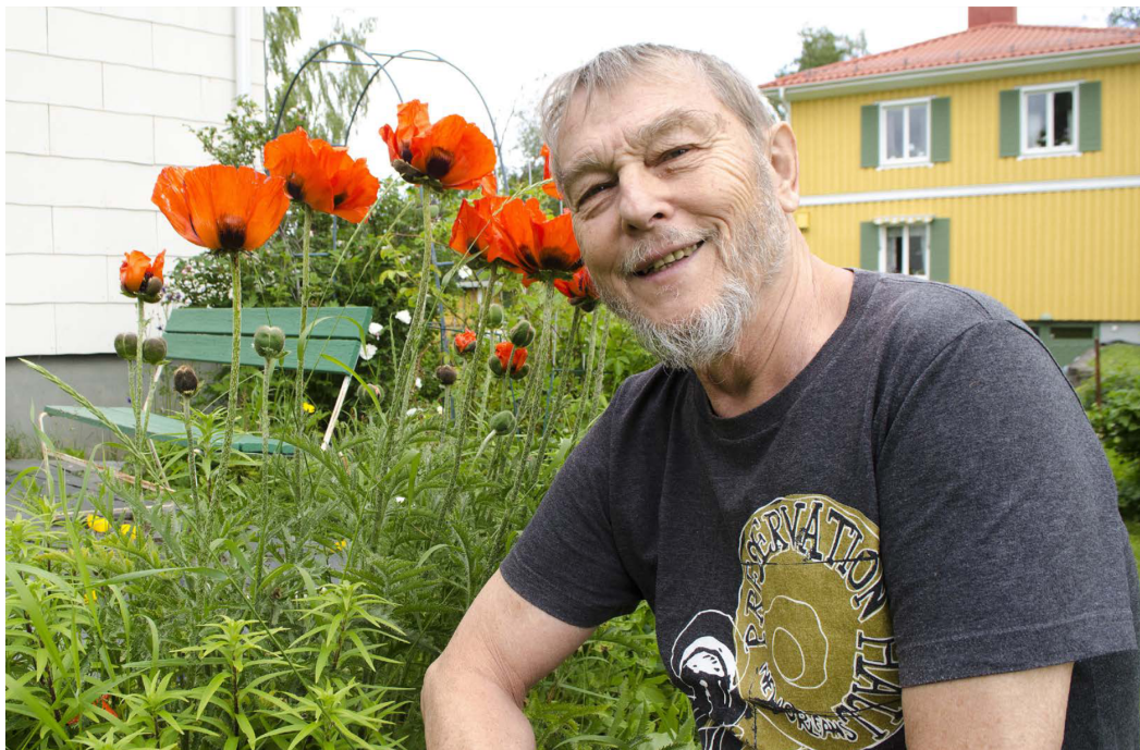
Bengt Ingelstam har skrivit böcker för barn sedan 1969 och även mycket dramatik. Nu är han aktuell igen med "Rälsspikarnas sammansvärjning".